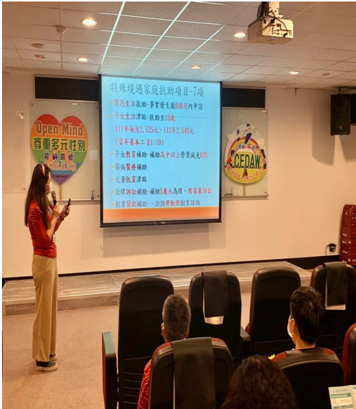
特殊境遇宣導實況