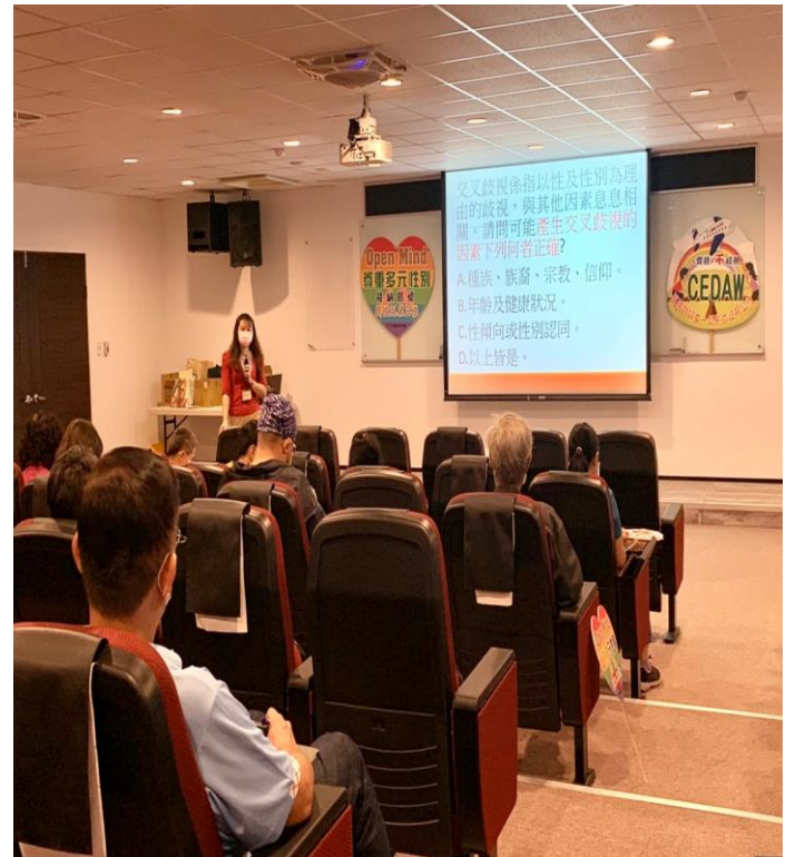
性別平等有獎徵答