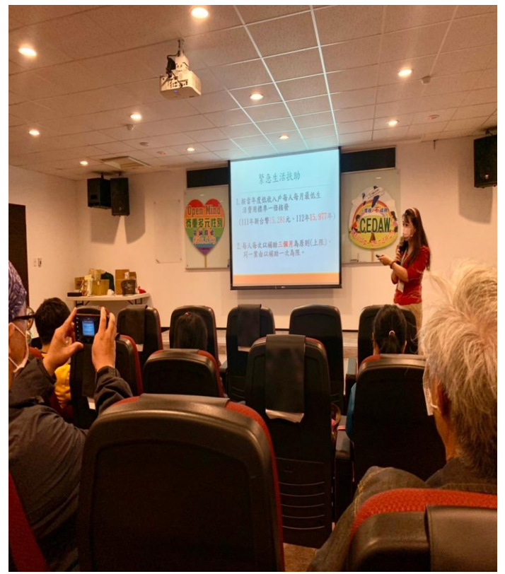
特殊境遇宣導實況