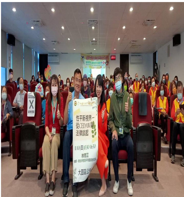
教育中心與承辦單位及民眾大合照