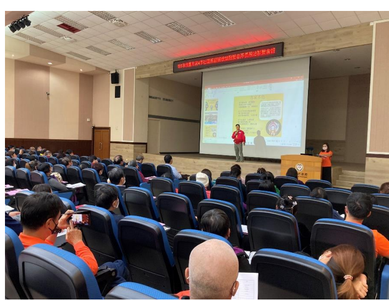
聯繫會報參與者仔細聆聽獲獎者演唱性平歌曲及性別議題剖析。