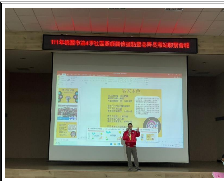
獲獎人說明唐山過臺灣的艱辛過程，也形塑了傳統對於客家男性的堅毅形象。