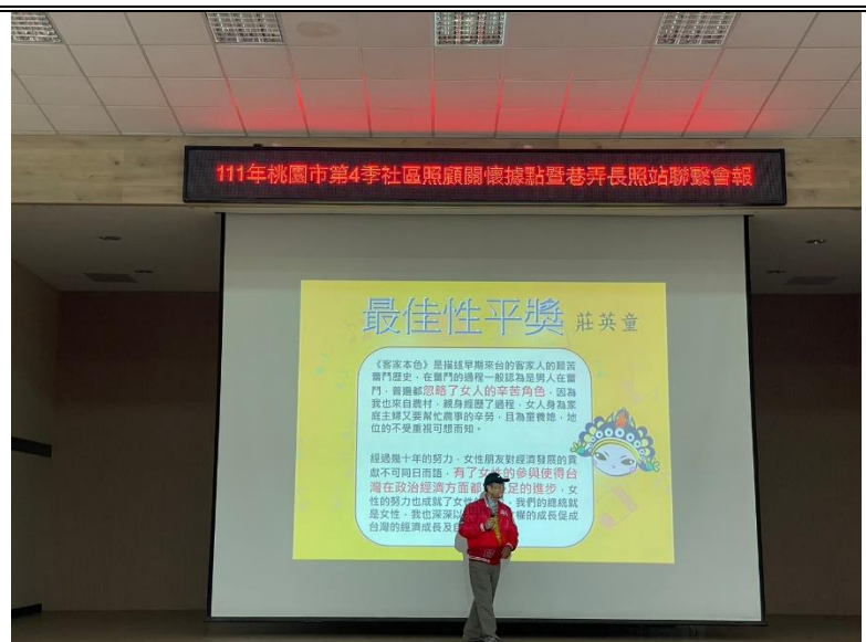
由獲獎者演示比賽曲及道出性平心得，將性平新知回饋至據點中高齡族群。