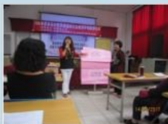
多元化性別意識及性別平等宣