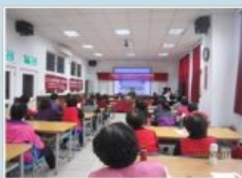
多元化性別意識及性別平等宣