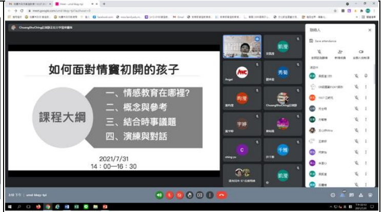
講師說明情感教育的重要性