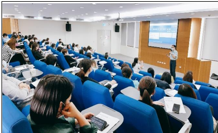
職業醫學科醫師說明 保護母性之工作措施