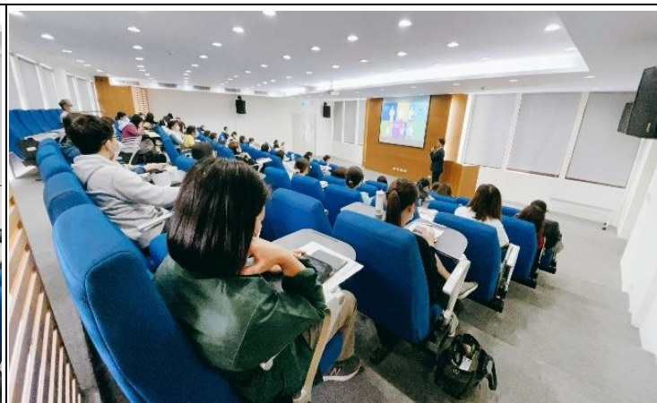
109 年度獲獎模範單位分享推動母 性健康保護實務經驗與創新作為