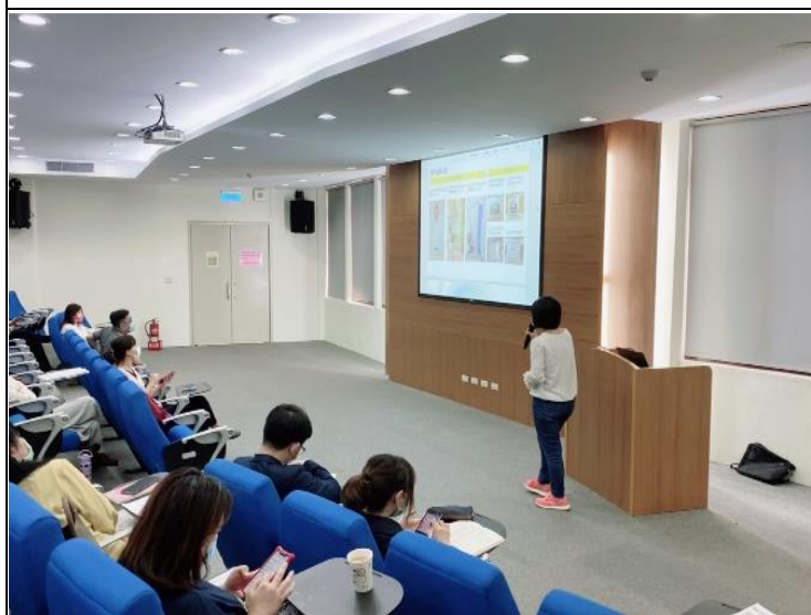
109 年度獲獎模範單位分享推動母 性健康保護實務經驗與創新作為