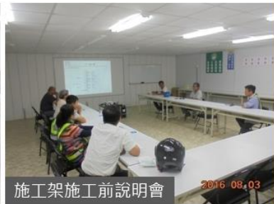
施工架施工前說明會