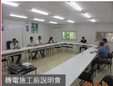
機電施工前說明會