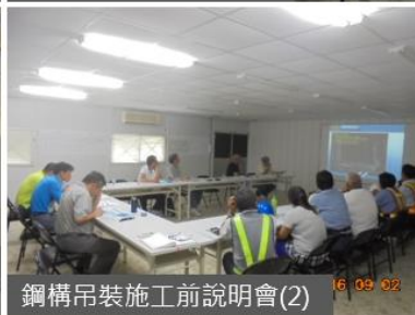
鋼構吊裝施工前說明會(2)