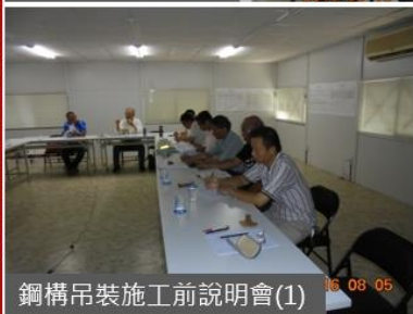
鋼構吊裝施工前說明會(1)