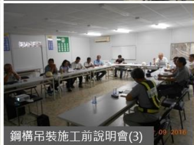
鋼構吊裝施工前說明會(3)