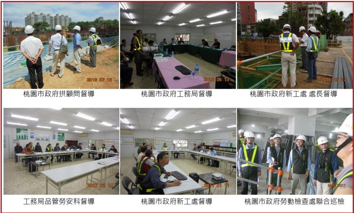
桃園市政府拱顧問督導