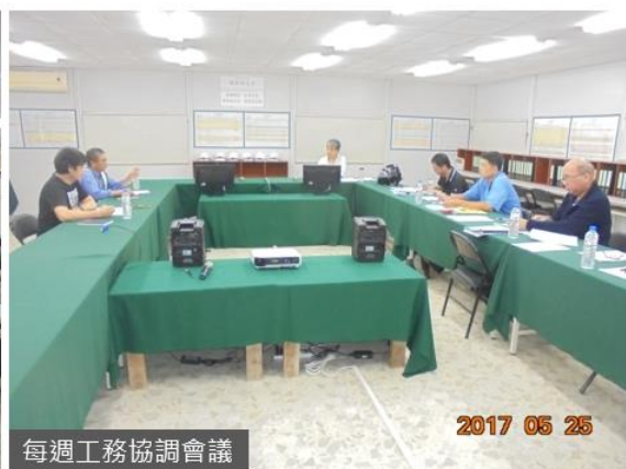
每週工務協調會議