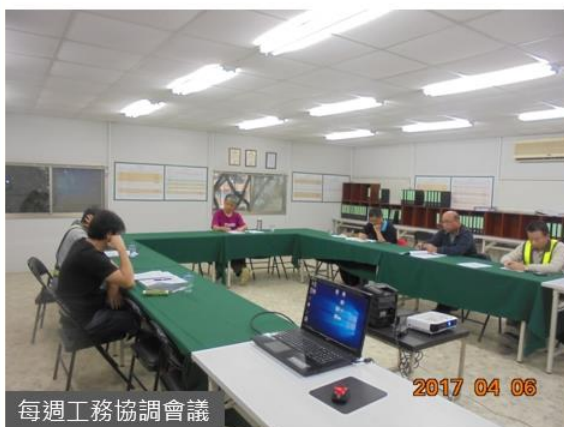
每週工務協調會議

要求施工團隊每週二召開施工協調週會，對工程進度、品質、安全衛生等執行現況，實施檢討與建議。