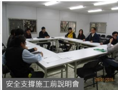
安全支撐施工前說明會